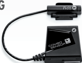
ANY ANT+ SPEED/CADENCE SENSOR*

* NOT REQUIRED FOR QUBO DIGITAL AND ARION DIGITAL